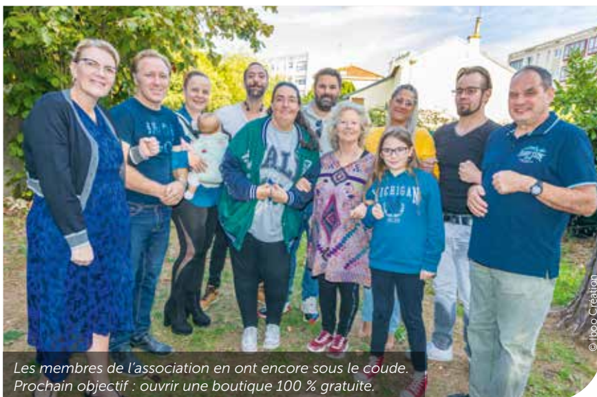
Les membres de l'association en ont encore sous le coude. Prochain objectif : ouvrir une boutique 100 % gratuite.