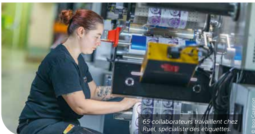
65 collaborateurs travaillent chez Ruel, spécialiste des étiquettes.