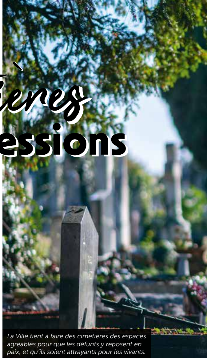
La Ville tient à faire des cimetières des espaces agréables pour que les défunts y reposent en paix, et qu'ils soient attrayants pour les vivants.

Le futur cimetière comprendra d'autres espaces distincts : jardin du souvenir, espaces funéraires et