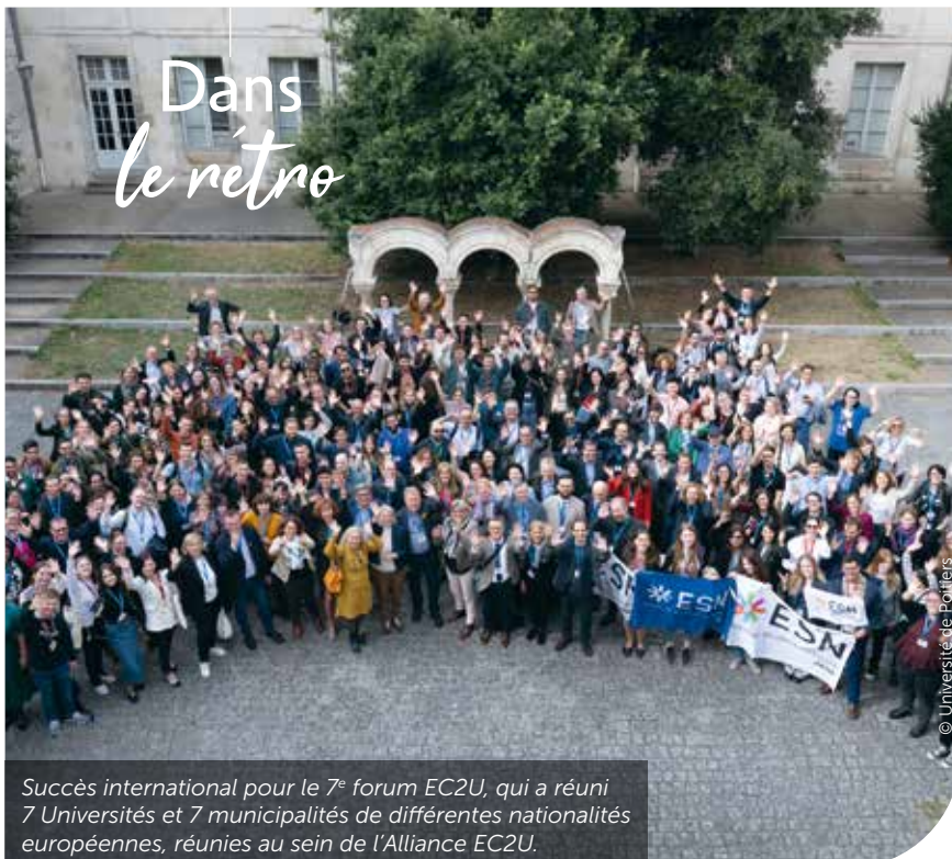
Succès international pour le 7 e forum EC2U, qui a réuni 7 Universités et 7 municipalités de différentes nationalités européennes, réunies au sein de l'Alliance EC2U.