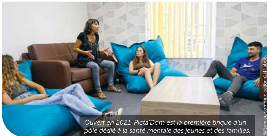
Ouvert en 2021, Picta'Dom est la première brique d'un pôle dédié à la santé mentale des jeunes et des familles.