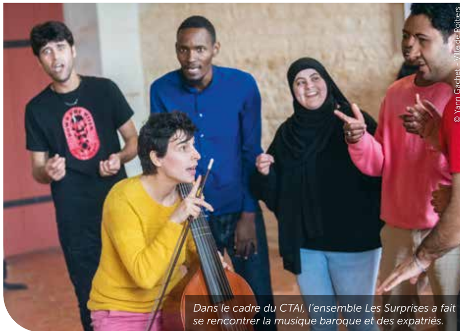
Dans le cadre du CTAI, l'ensemble Les Surprises a fait se rencontrer la musique baroque et des expatriés.