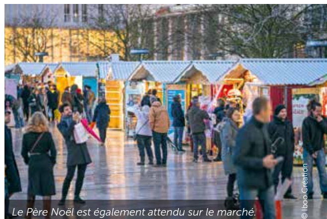
Le Père Noël est également attendu sur le marché.