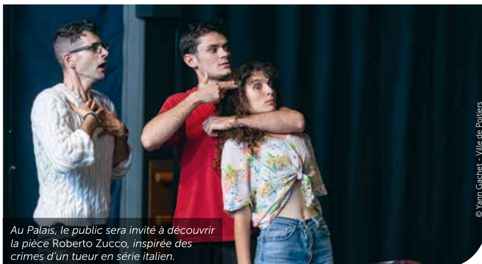
Au Palais, le public sera invité à découvrir la pièce Roberto Zucco, inspirée des crimes d'un tueur en série italien.

➔ Du 21 au 27 novembre au TAP, de 3,50 € à 27 €