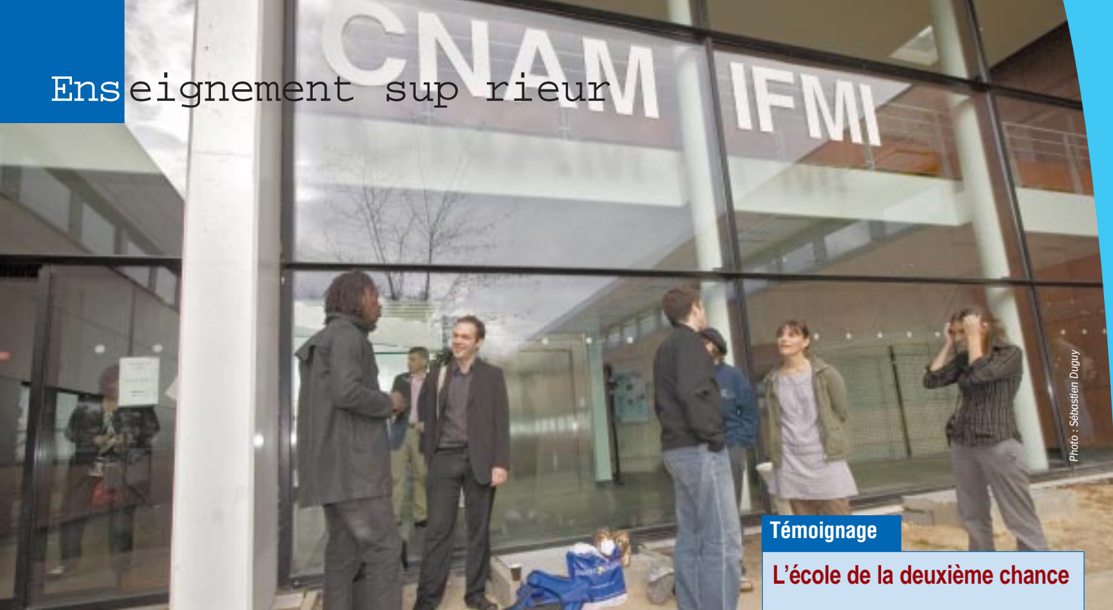
Chaque année, plusieurs centaines de personnes se forment au Cnam de Poitiers.

k Conservatoire national des arts et métiers